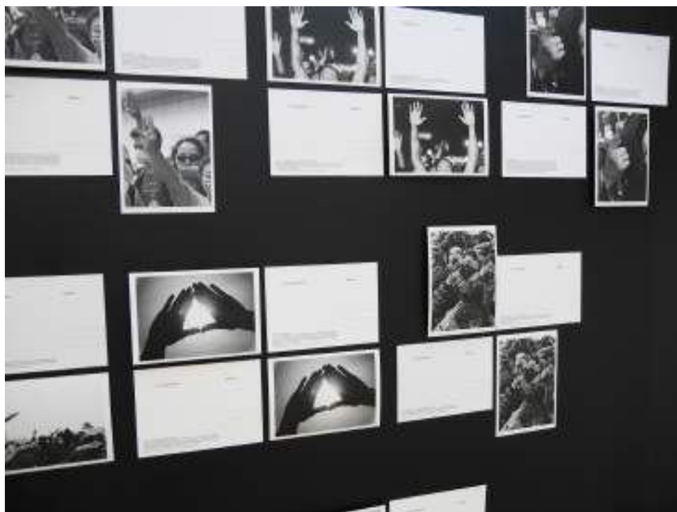
Silent Slogan, cartes postales, série de 32, 700 exemplaire, capture d'écran, texte bilingue français et anglais, impression offset, 105x148 mm chaque 2016 - en cours

première fois qu'internet était investi aussi intensément par des mouvements de protestation. Voir comment les gens peuvent s'accaparer un espace et le transformer du simple fait qu'ils se réunissent, ce n'est pas inédit, mais c'est quelque chose qui m'émeut.