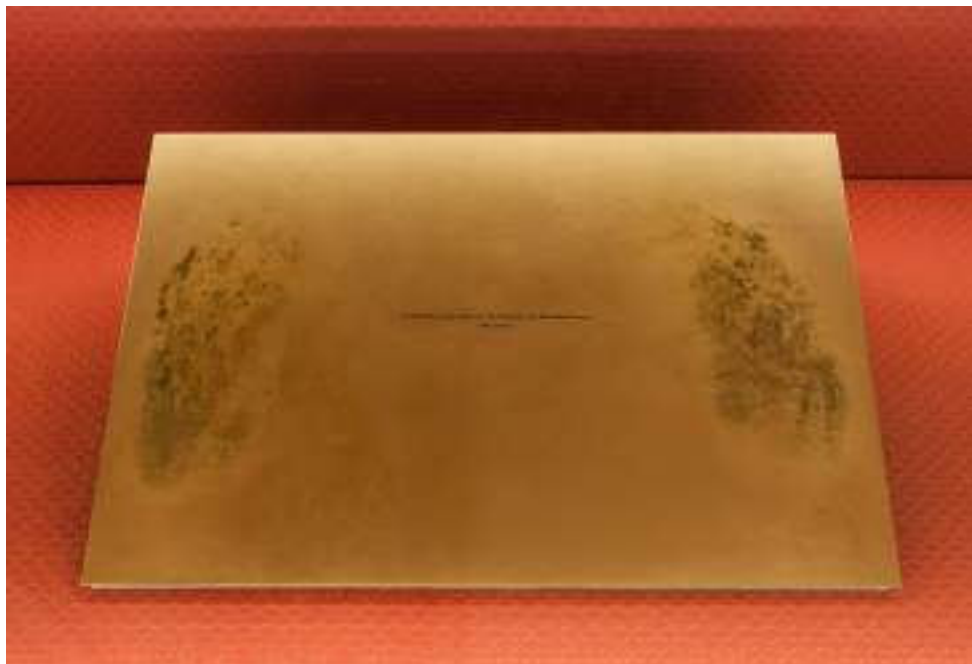
Le Superflu doit attendre ("les femmes ou les silences de l'histoire" de Michelle Perrot), action performative, plaque de cuivre sérigraphiée, oxydation, série de 11, 40x30cm, 2018.