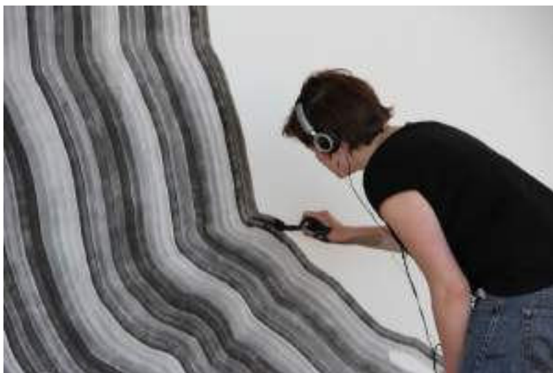
Mesurer les actes, action performative n°01 du 8 mars 2011, 457min, FRAC Alsace, Sélestat, dessin in situ, action performative de dessin, encre de chine sur mur, pinceau petit gris, dimensions variables.