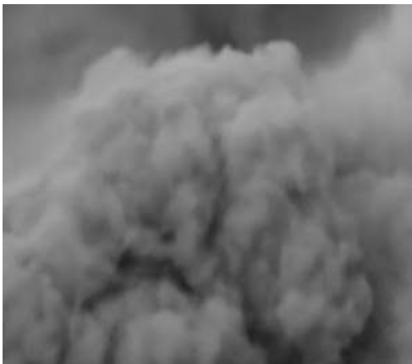
Évanouissements, installation, vidéo noir et blanc sans son, 7'40", dimensions variables, prod. Palais de Tokyo, 2018

Évanouissements est composée de plusieurs vidéos que j'ai trouvé sur internet où des gens ont filmé des déconstructions d'immeubles avant de les partager sur Youtube. Je me suis demandé pourquoi ils faisaient ça et pour quel intérêt ? Il y a quelque chose de l'ordre de la perte de conscience entre ces bâtiments, ces corps qui s'effondrent et nous qui sommes aussi presque en train de nous effondrer dans notre tête lorsque l'on regarde ces images, hypnotisés. Pour cette création, j'ai passé les vidéos en noir et blanc et je les ai ralenti de sorte qu'on ne voit que des volutes de fumées, avec de temps en temps des indices d'éléments architecturaux qui apparaissent à l'écran.