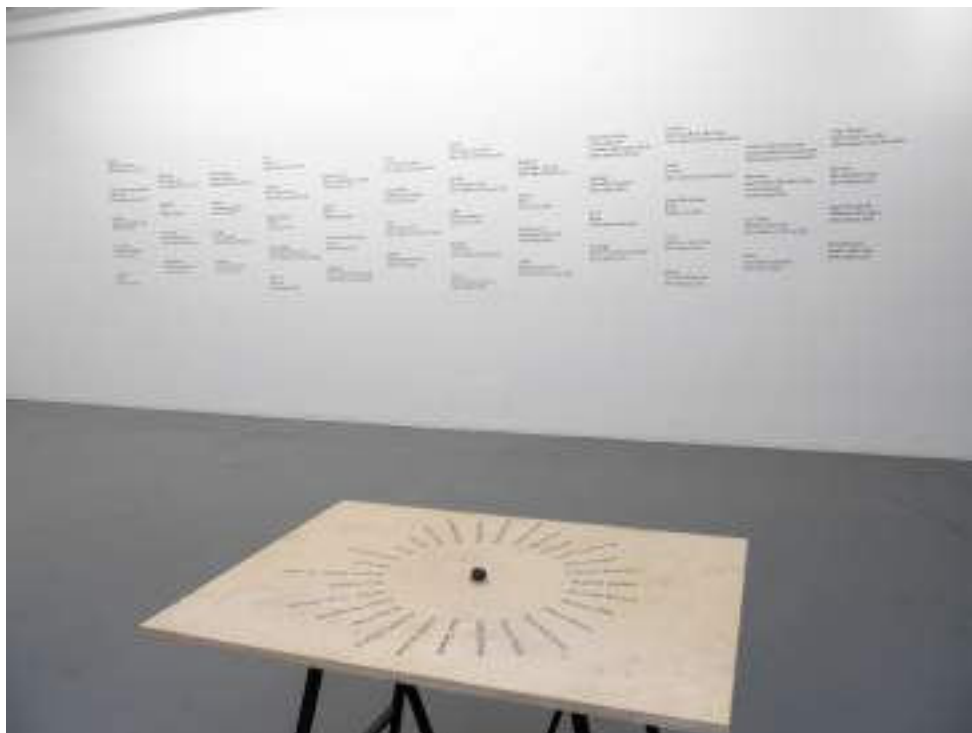
Bibliothèque des silences, dessin mural in situ au fusain, table d'orientation des locuteurs, encre sur bois, dimensions variables, 2017 – en cours

Cette création est en fait le contrepied du mythe de la Tour de Babel, qui divise les gens, par une instance divine, en leur adressant des langues différentes. Impossible alors pour eux de s'entendre et de se comprendre, puisqu'ils ont des façons différentes de penser et de voir le monde. Ce qui ressort de ce récit biblique, c'est que les langues séparent les hommes alors que pour moi, elles sont une richesse qui nous fait voir la disparité des façons de comprendre le monde. C'est ce que j'ai essayé de mettre en lumière dans cette Bibliothèque des silences .